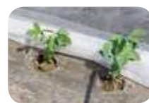
6月に出荷予定の枝豆

―これからの抱負を教えてください。 早く周りの方々に認めてもらえるように、栽培技術をしっかりと身に付け、品質を向上させたいと思っています。また、急には作付け面積を増やせませんが、今期から家内も手伝ってくれる事になり余裕もできるので、今後は徐々に規模を拡大したいと思っています。