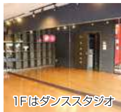
1Fはダンススタジオ