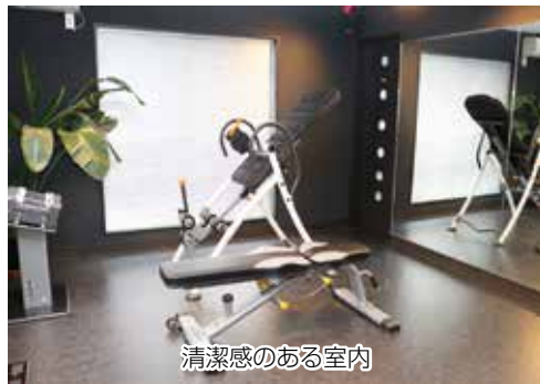
清潔感のある室内

【住 所】 柏市高柳 1142-9 【TEL】 04-7170-4210 【URL】 https://haccieight.jp/ 【メール】 info@haccieight.jp